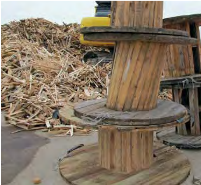
TAMBOURS DE CÂBLES