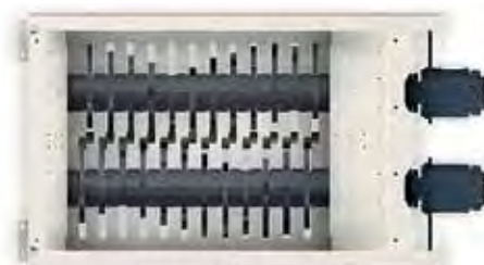
TABLE DE COUPE 4 000 – 12 COUTEAUX