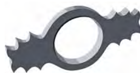
ARBRE DE NOËL

***En fonction du chargement, de la granulométrie et de la densité du matériau entrant