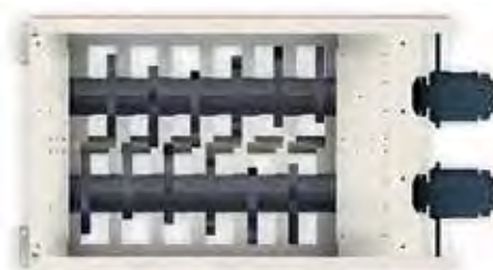
TABLE DE COUPE 4 000 – 6 COUTEAUX