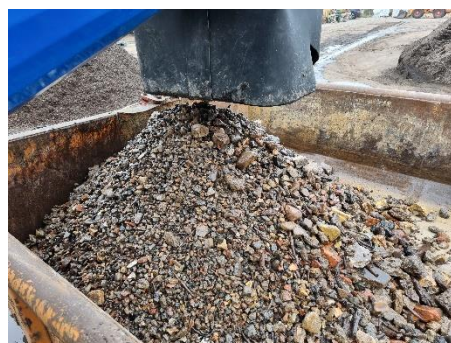
Fraction lourde séparée HDS-S