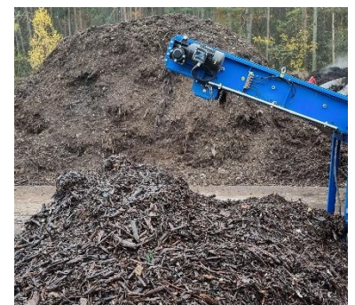
Fraction légère séparée HDS-S