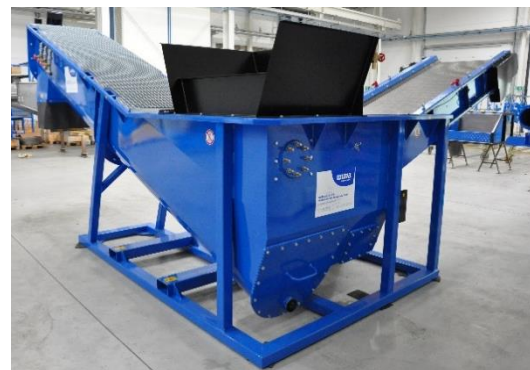
Vue HDS-S de la trémie d'alimentation et trappes de visite