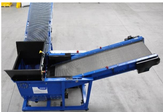
Vue du dessus HDS-S