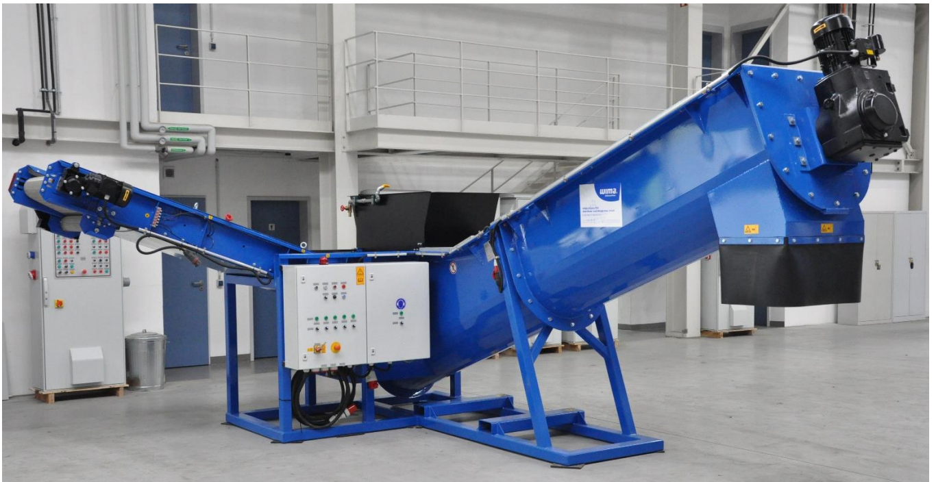
Vue HDS-S du convoyeur à vis, de l'armoire électrique et du convoyeur d'évacuation

Grâce à la vitesse du flux, les matériaux d'une densité supérieure à 1\text{g/cm}^3 peuvent être transférés dans la fraction légère.